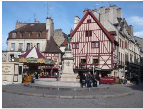
Platz in Dijon