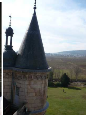
...auf dem Schulgelände