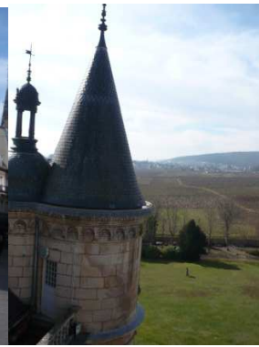
...auf dem Schulgelände