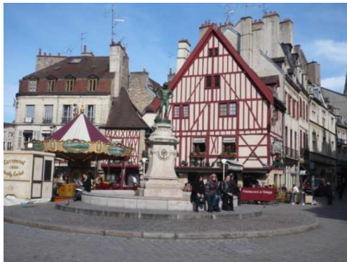
Platz in Dijon